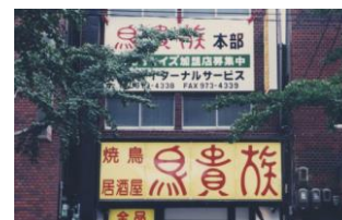
設置された本社事務所(1997)