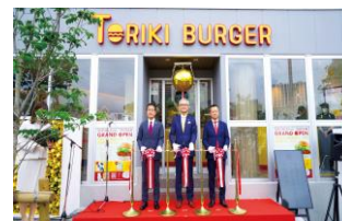
TORIKI BURGER オープンセレモニー (2021)