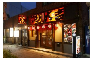
「やきとり大吉」のグループ化 (2023)