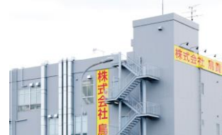
移転した本社事務所 (2010)