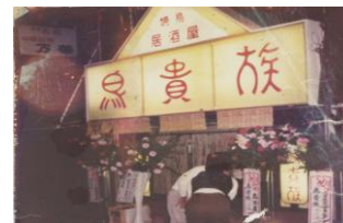
鳥貴族1号店「俊徳道店」(1985)